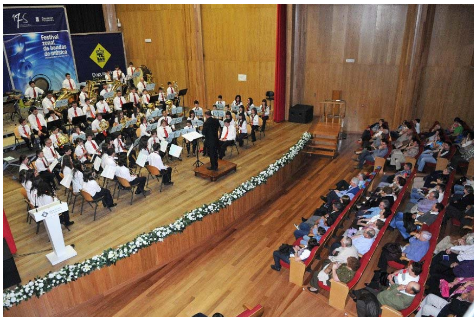
2011.- III Certamen Zonal Provincial de Bandas de Música. Diputación de Pontevedra. Valga (Pontevedra). Primera Sección (este año no se realizó concurso).