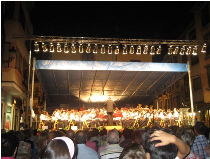
2009.- X Certamen Internacional de Bandas de Música "Villa de Aranda". Aranda de Duero. (Burgos) 4º Premio, Mención de Honor.