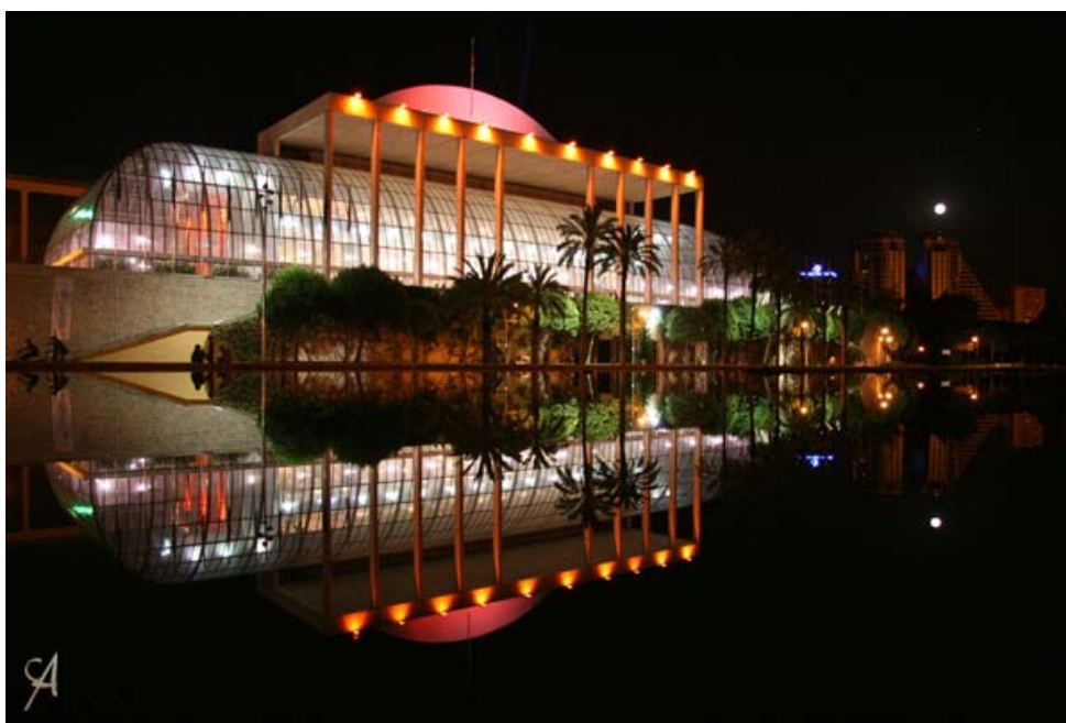
Palau de la Música de Valencia.