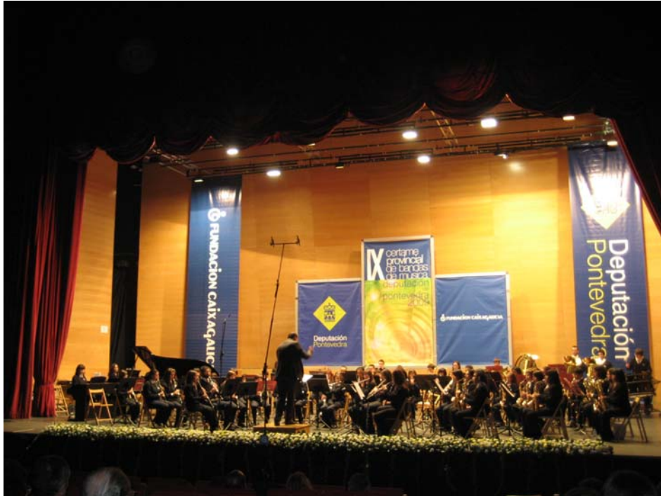
2009.- IX Certamen Provincial de Bandas. Diputación de Pontevedra. Pontevedra. Primera Sección.