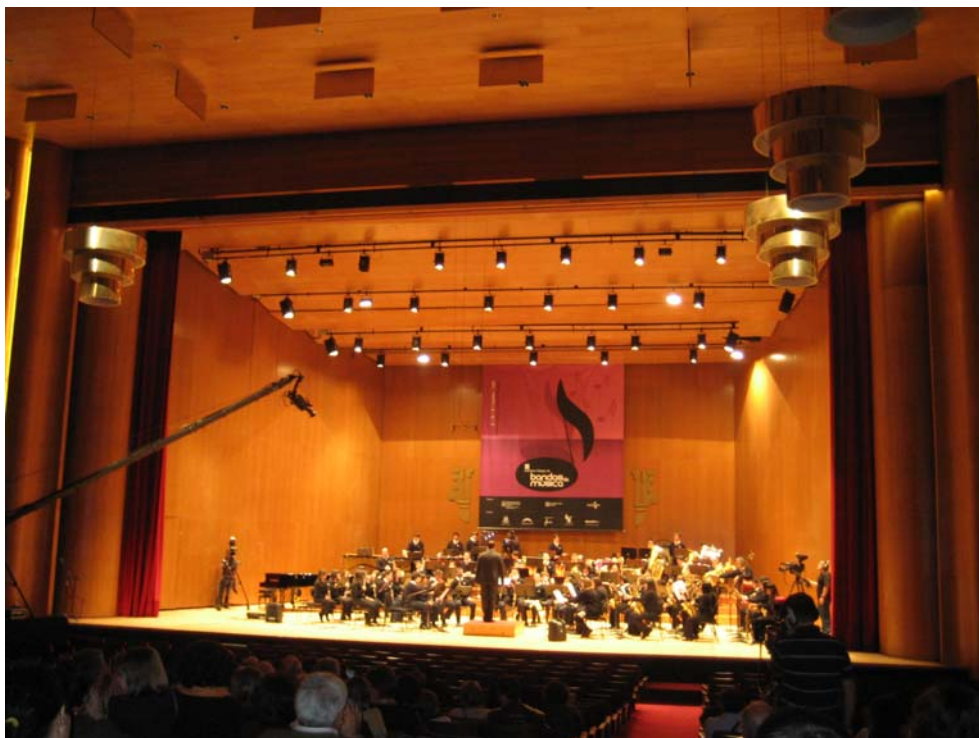
2009.- III Certame Galego de Bandas de Música. Federación Galega de Bandas de Música. Santiago de Compostela Primera Sección. Segundo premio.