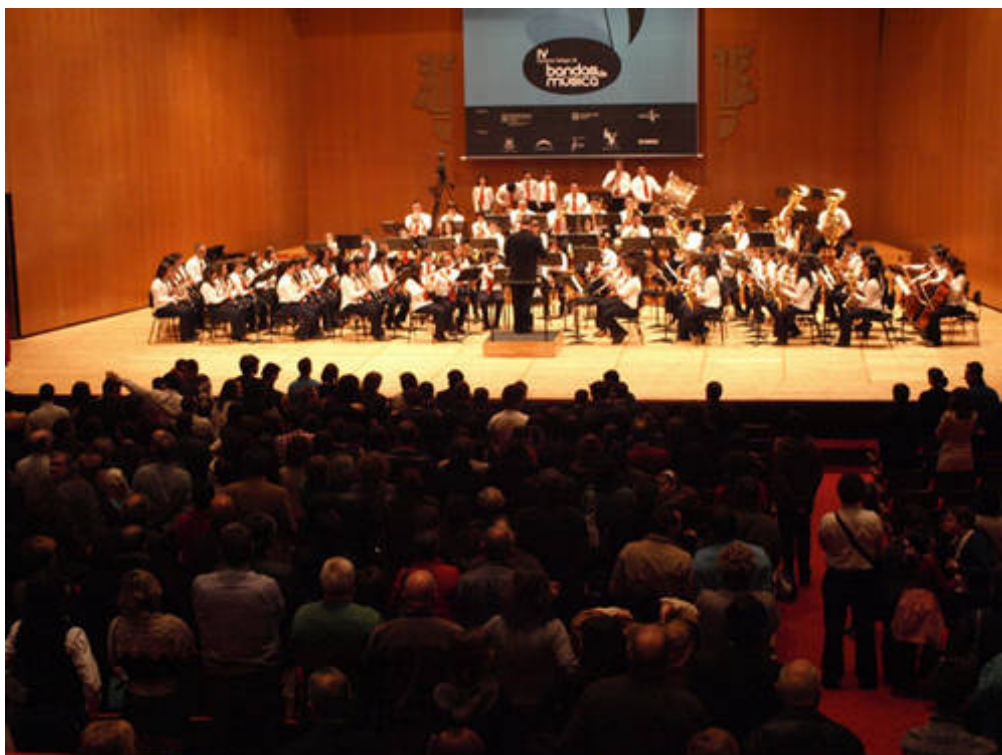
2010.- IV Certame Galego de Bandas de Música. Federación Galega de Bandas de Música. Santiago de Compostela Sección Especial. 2º Premio