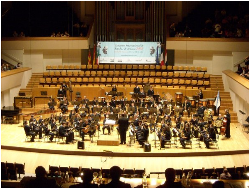
2008.- 122º Certamen Internacional de Bandas de Música Ciudad de Valencia. Segunda Sección: Premio Especial, Mención de Honor.