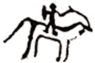
Esceas de monta a cabalo