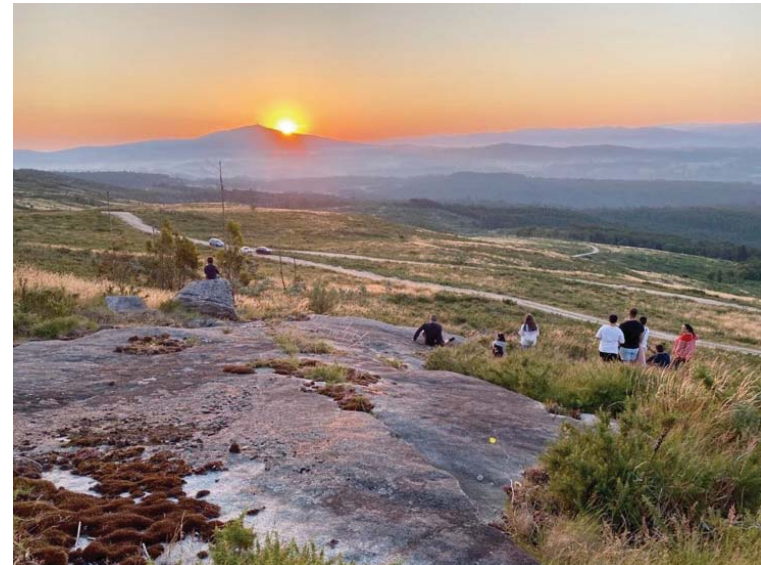
Imaxe dende Laxe dos Bolos da saída do sol no solsticio de verán por detrás do Monte Xesteiras.

Con que nome coñecemos a celebración do solsticio de verán? De que data do ano estamos a falar?